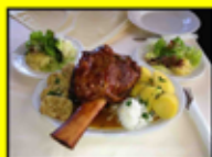
Spezialität des Hauses - Kalbsax'n (mit 2 Portionen mit Kartoffeln, Salat und Sauce)