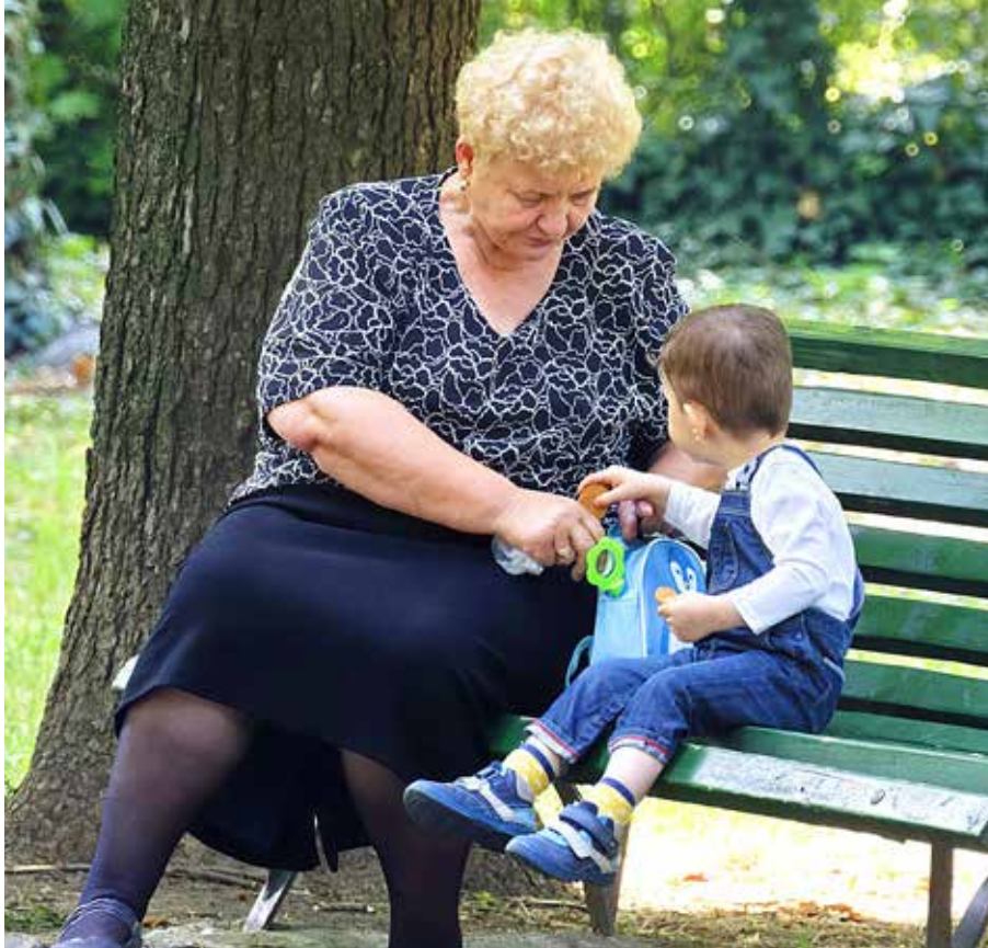
Der Pfarrgarten soll zur Begegnungszone für Jung und Alt werden. Im Schatten der Bäume können Omis und die Kleinen frische Luft schnappen, rasten und die Kinder können die Spielgeräte nutzen.