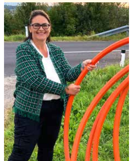
Viele Einwohner in den Ortschaften haben uns gebeten, den Breitbandausbau voranzutreiben. Wir bleiben dran, um die Infrastruktur im ländlichen Raum zu verbessern.

Auch wenn unser Gebiet als Lücke zwischen Peuerbach und Neukirchen erschlossen werden soll, in der nächsten Ausbaustufe, wird es mindestens zwei Jahre dauern, bis die auswärtigen Ortschaften eine schnelle Datenanbindung nutzen können.